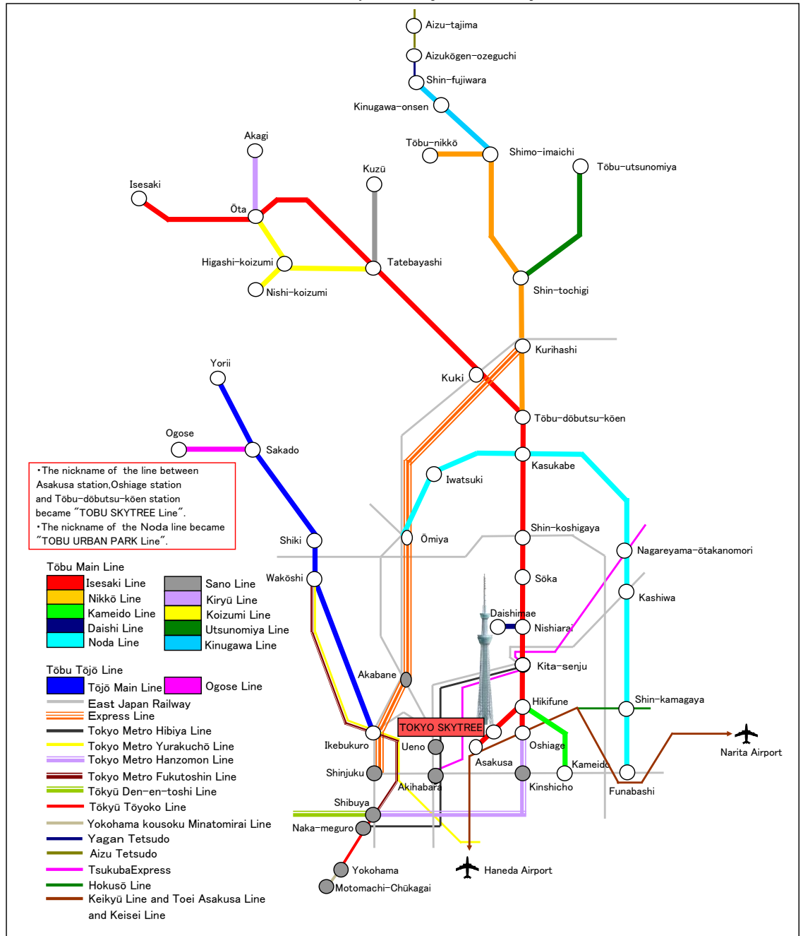
Tōbu Railway Lines (major stations only)